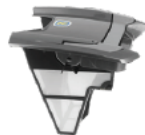
Filter für feine Rückstände 100µ Fine filter canister 100µ