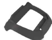
Kontrollbox - Halterung Control box base