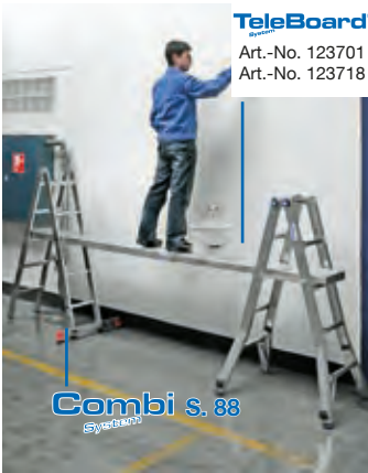
TeleBoard Art.-No. 123701 Art.-No. 123718