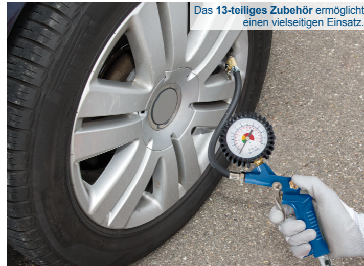
Das 13-teilige Zubehör ermöglicht einen vielseitigen Einsatz.